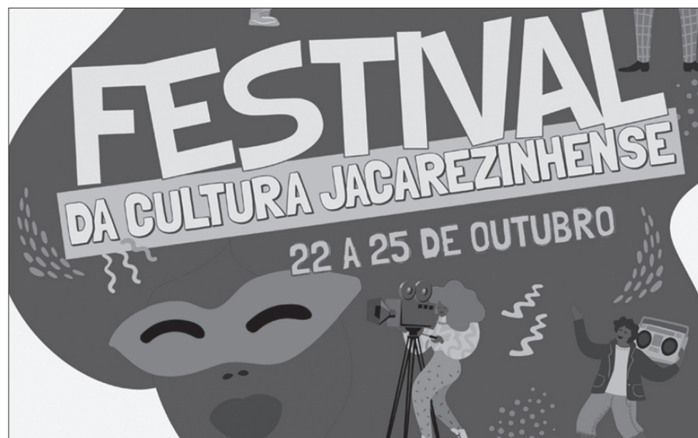
Evento será transmitido através de site, You Tube e Facebook

Mais informações sobre o Festival e a programação completa estão disponíveis em https://www.culturajacarezinho.com.br/ (Da assessoria)