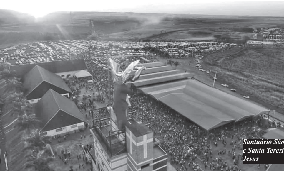
Santuário São Miguel Arcanjo e Santa Terezinha do Menino Jesus